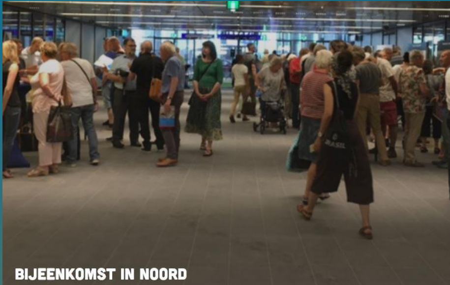
BIJEENKOMST IN NOORD